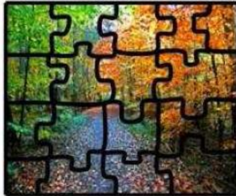
Puzzle selbst gestaltet