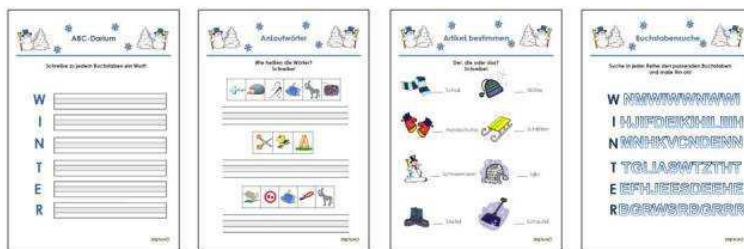
Einige Beispiele aus dem bunten Angebot der Arbeitsblattsammlung